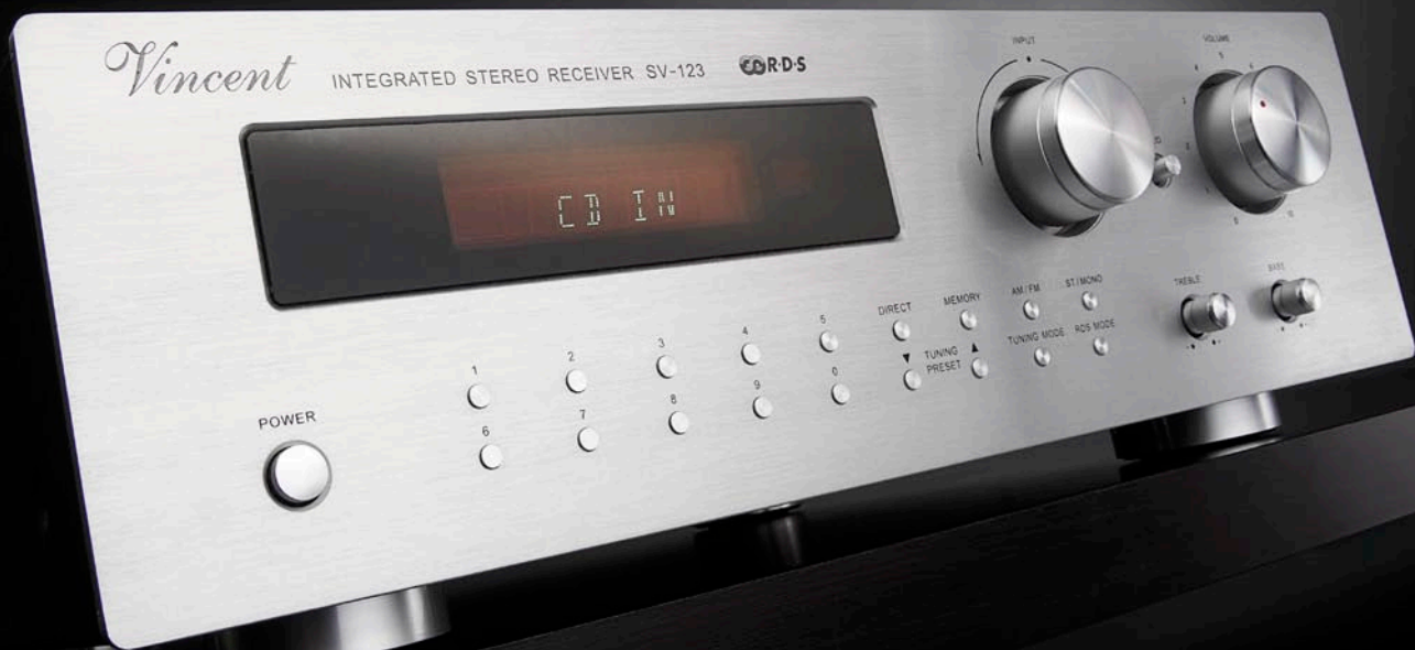
Stereo-Receiver Vincent SV-123